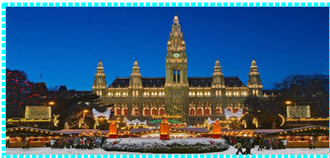
Boże Narodzenie. Jarmark w Wiedniu

Co ciekawe, prezentów nie przynosi Święty Mikołaj, ale Kristkindl, czyli Dzieciątko Jezus.